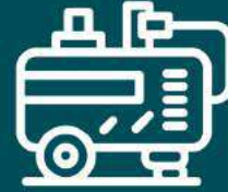
Centrais de gerador a Diesel